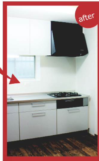
キッチン最新式のシステムキッチンへ。