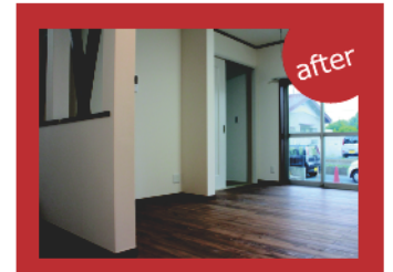
間仕切りを排除し一つの大きな部屋とすることで、明るい雰囲気のリビングに様変わりしました。