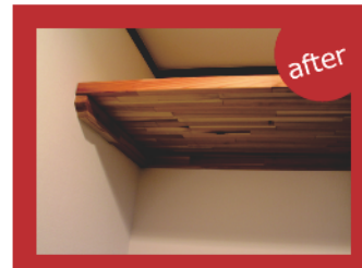
トイレに設置した造作戸棚。こうした細やかな工夫ができるのも中古ならではのです。