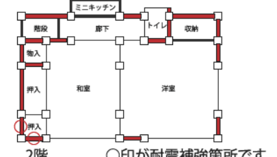
○印が耐震補強箇所です。